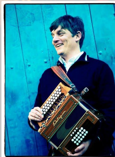
Bruno LE TRON

Acteur créatif et dynamique du renouveau de l'accordéon diatonique en France, Bruno Le Tron étonne par son style inimitable, tout en énergie. Compositeur reconnu, il sillonne les scènes françaises et internationales au sein de diverses formations depuis plus de 30 ans, aux côtés des plus grands noms de la musique traditionnelle, Tref, Maubuissons, la Cie du beau temps, The accordion Samurai... Sa riche carrière est également ponctuée de nombreux stages qu'il anime dans toute l'Europe.